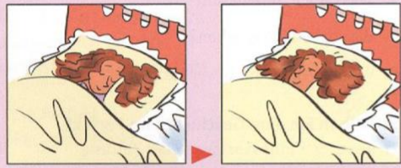
Ich bin aufgewacht.