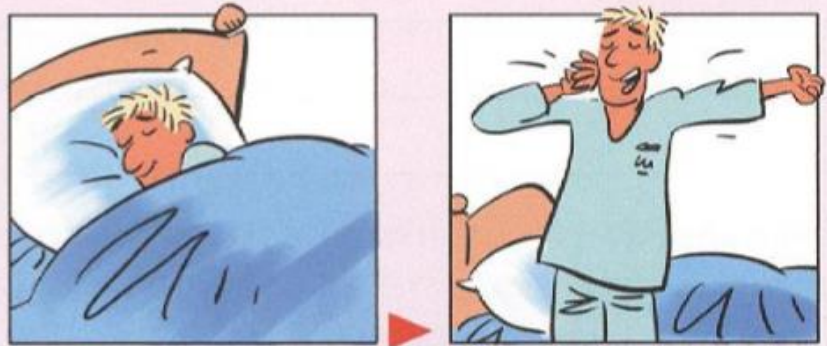
Ich bin aufgestanden.