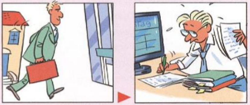
Ich bin zur Arbeit gegangen.